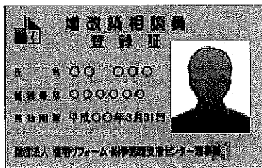
増改築相談員登録カード (顔写真入り免許証タイプ)