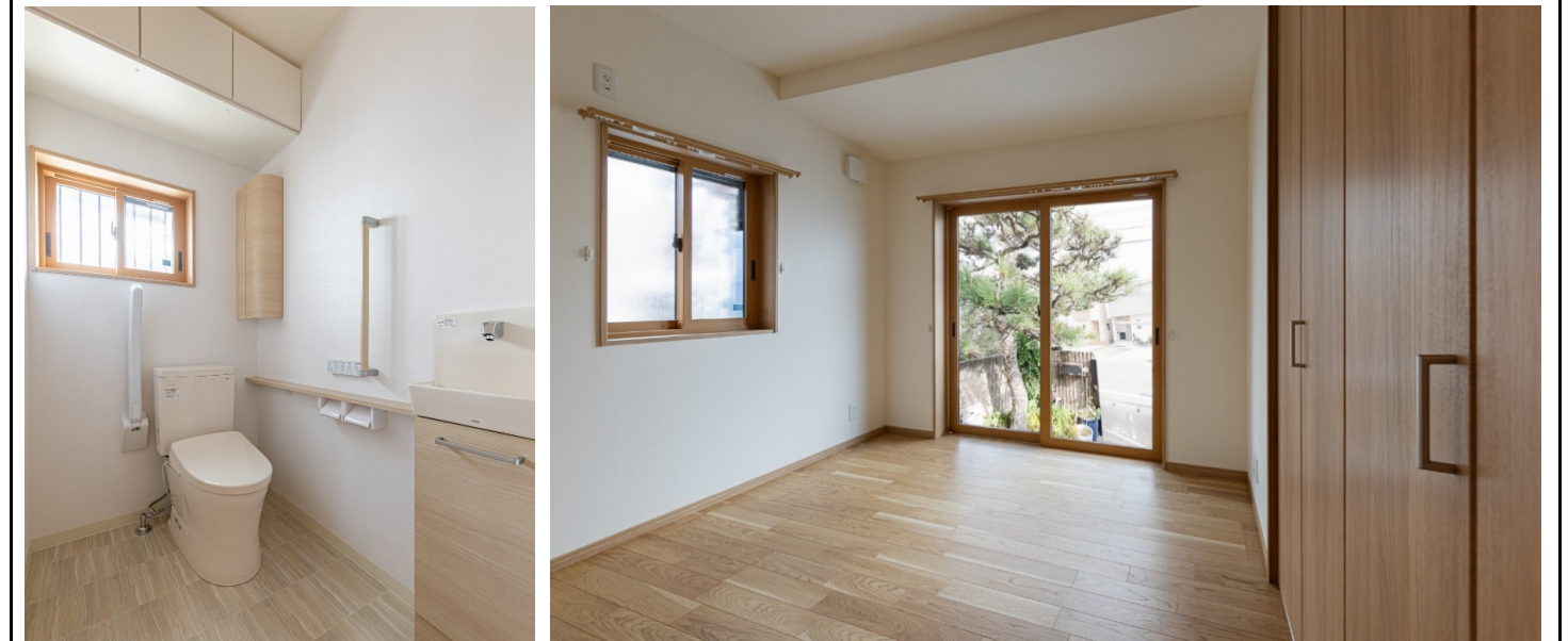
C 玄関からアクセスしやすいトイレ