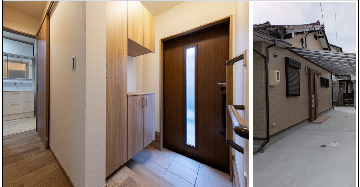
A 玄関ドアは引戸とし、手摺と式台を設置