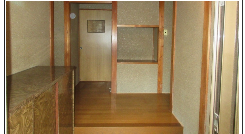
高さが高く困っていた上がり框