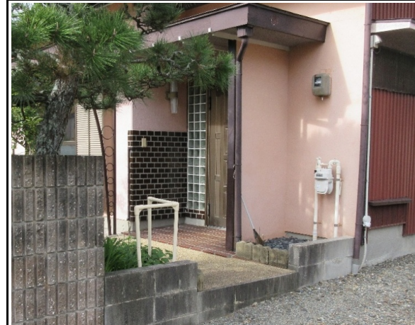
車庫からのアプローチに段差がありました