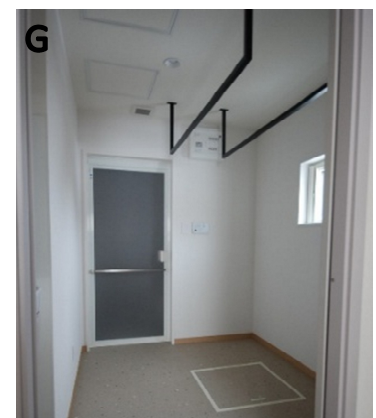
物干し充実の脱衣室