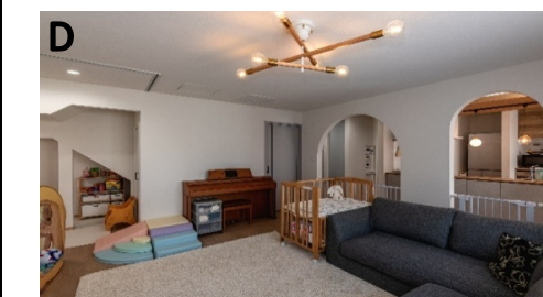
階段下は長女（2歳）の格好の遊び部屋となっている。