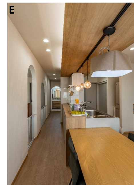
キッチンと脱衣室に隣接させている