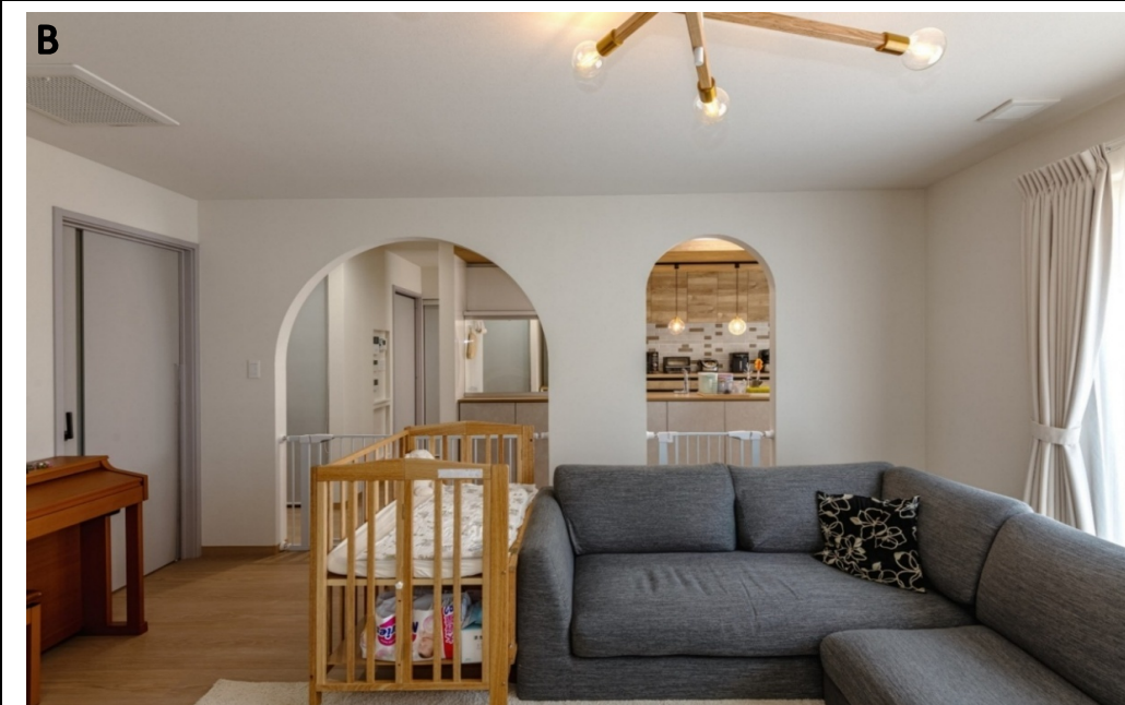
連続したアーチが特徴のリビングとキッチンの壁