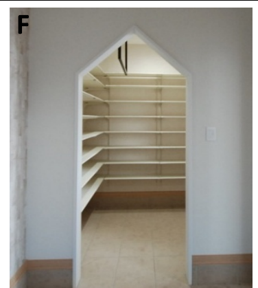
シューズクローク