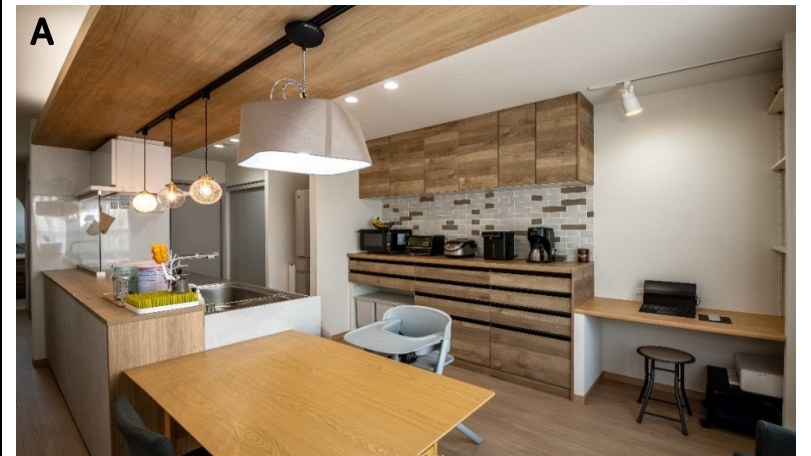
キッチンにカウンター、本棚を設けて、奥様の書斎スペースをつくった。