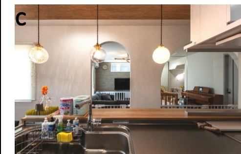
キッチンからリビングが見渡せる。