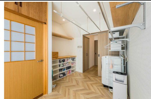
①階段下部分は家族分の服が収納できるスペースに！