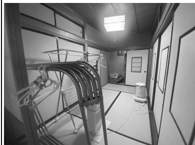
A:洗濯物干スペースだった和室