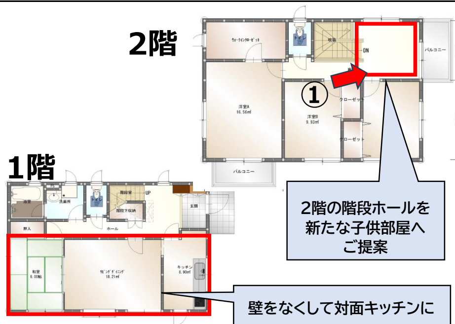
リフォーム後の平面図