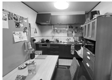
a. 閉鎖的な壁付けキッチンと2人しか座れなかったダイニング。窮屈なLDKでした。