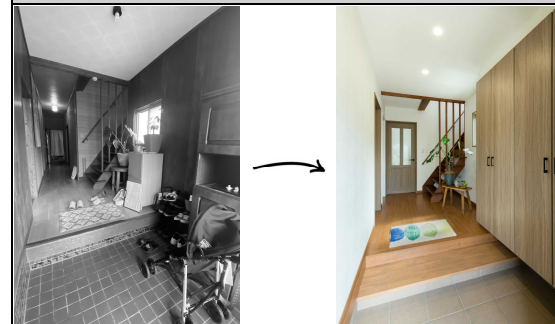
b. 段差が高かった玄関と暗い中廊下