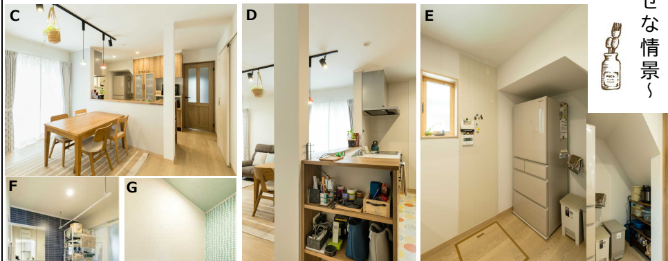
D. 柱を活かした造作棚。Wifiなどの機器類や鍵、時計などなんでも置けるマルチ収納。 E. 階段下は冷蔵庫、ごみ箱とお米などを置けるちょこっとパントリースペースに。窓横にはマグネットパネルを貼り、家族の連絡ボードとして活用。 F. 収納ケースも置けるように広く計画。室内干しにも対応可。 G. 誰でも使いやすいよう配置を変え、奥様好みの可愛い内装に。