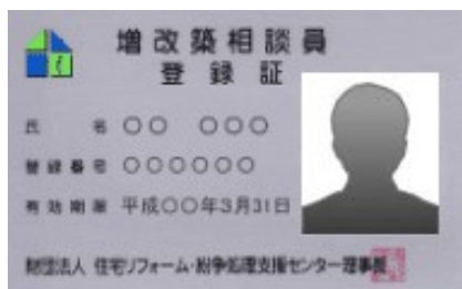
増改築相談員登録カード (顔写真入り免許証タイプ)