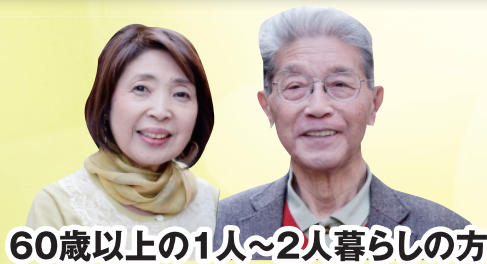
60歳以上の1人~2人暮らしの方