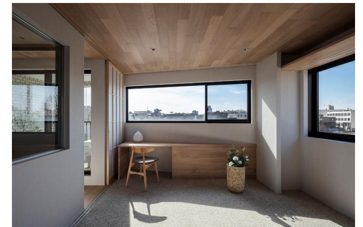
7階 リフォーム後 サブリビング・バスルーム

LDだけで35畳もの広さがあったため、床面は広々と連続つづ天井面を操作することで空間を緩やかに文節していきました。