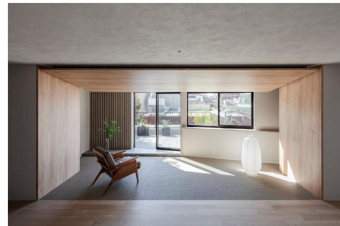
6階 リフォーム後 リビング(縁側)

LDだけで35畳もの広さがあったため、床面は広々と連続つづ天井面を操作することで空間を緩やかに文節していきました。