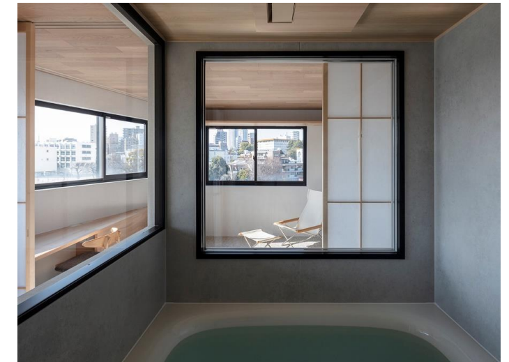
7階 リフォーム後 バスルーム・サブリビング

日本建築をモチーフにした天井として「欄間」「掛込天井」「折り上げ格天井」を参考に天井を設えていきました。