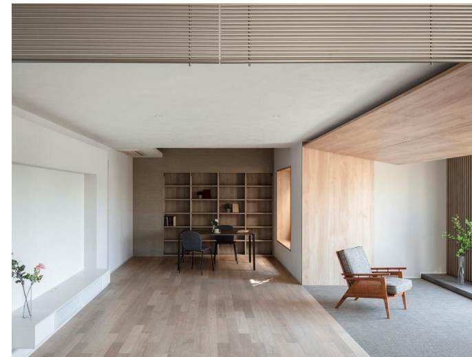
6階 リフォーム後 リビング

周囲から見られる心配のない7階には開放的なバスルームとサブリビングを配置することを提案しました。