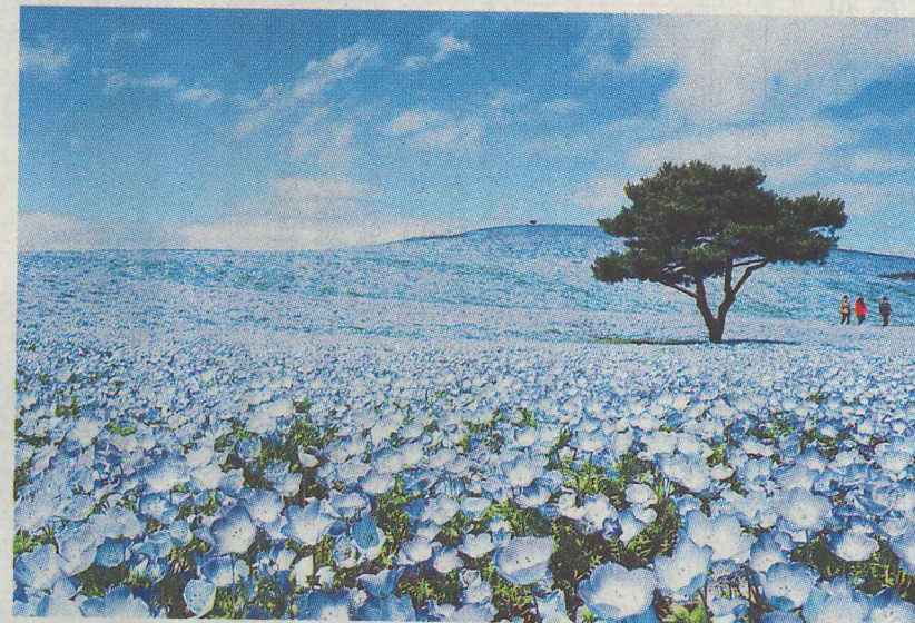
ネモフィラで青一面となるひたち海浜公園。たった一枚の写真がSNSで広がり、多くの外国人そして日本人が訪れるようになった

②では、顔認証技術を活用した自動化ゲートなどデジタルインフラなどをスムーズに行う、ファストトラベル、スムーズボヤージュを実現していく。また、日本が遅れているとされる無料WiFi-Fi環境の整備などを挙げている。 ③では、JNTOの改革や体制強化により、欧米豪を対象としたグローバルキャンペーンや富裕層対策の強化などを推進。また、世界的水準のDMOの形成、育成として、多様な主体がDMOの運営に関与する仕組みの構築、外国人目線による多言語表記の見直しを支援するとしている。 そして、MICE誘致の促進も挙げられており、ここに先ごろ成立したIR実施法を絡め