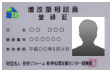
増改築相談員登録カード (顔写真入り免許証タイプ)